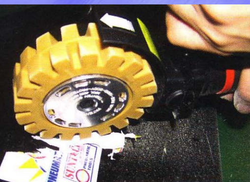
ステッカーはがし